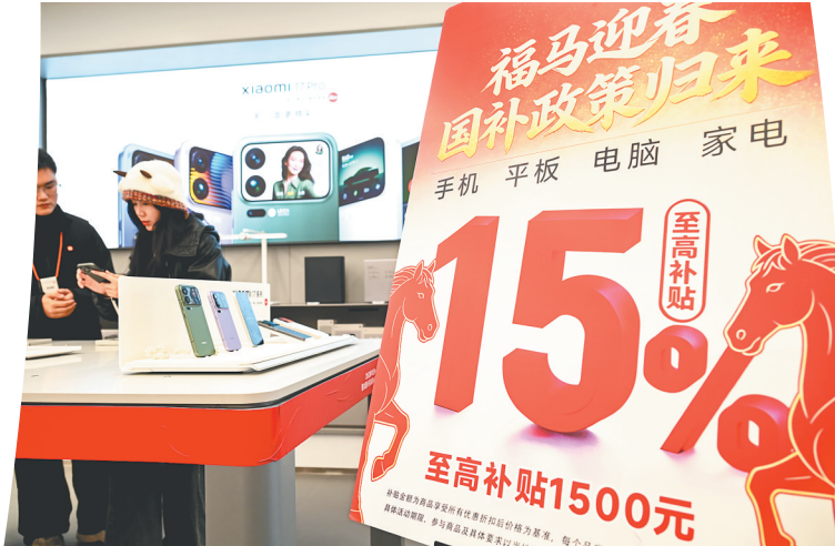
新年伊始,新一轮“国补”正式开始,消费者在江西省南昌市青云谱区一家手机销售门店选购手机。