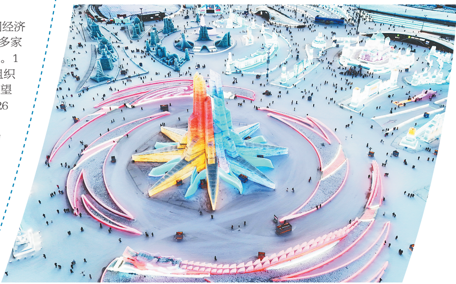
哈尔滨冰雪大世界园区。