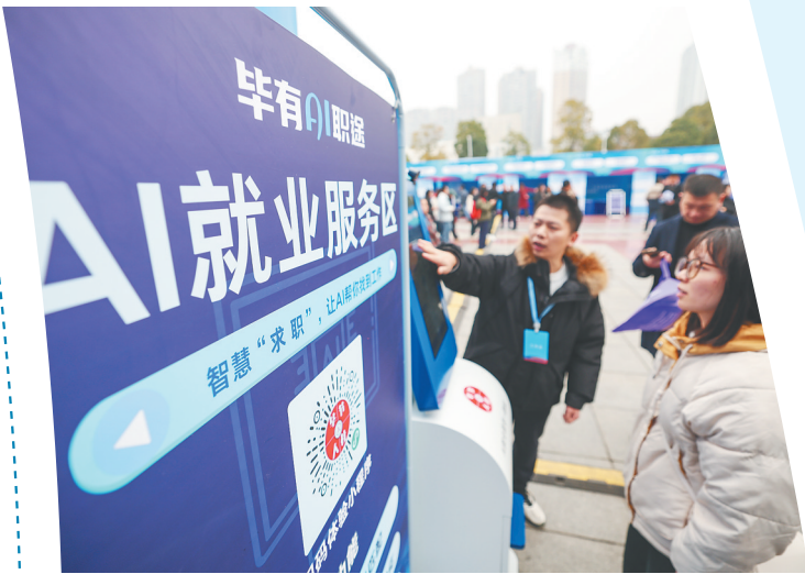
工作人员在贵州省2026年“春风行动”暨五省联动就业服务季活动现场介绍AI就业辅助系统。