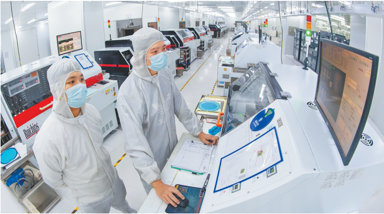
订单排了3个月 “海南智造”生产忙

库、碳库”四库规划，实现生态价值转化。 此外，五指山市在乡村治理工作上创新推行“乡村论坛+村规民约”“四维共治”和“十约共守”等治理模式，完善村民自治体系。五指山经验为热带雨林地区和重点生态功能区提供可复制的乡村振兴路径，多个村庄入选海南和美乡村，形成“生态+产业”“保护与发展协同”的生动实践。