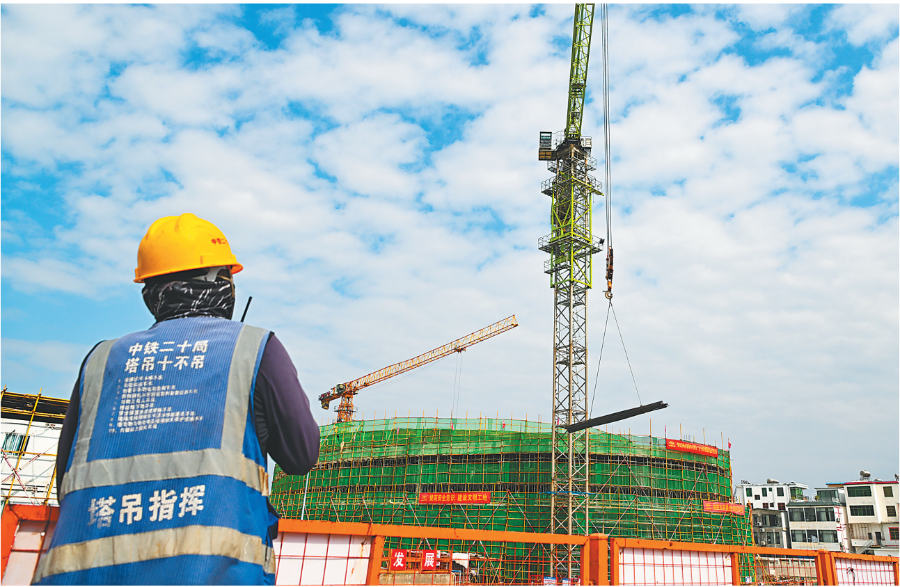
三亚：完善旅游配套 提升接待能力

标按时实现，会议部署了多项重点工作。包括大力度推动国际旅游消费中心建设，培育旅游消费超级品牌，丰富国际旅游消费供给，构建国际旅游消费集聚地，营造国际一流旅游消费环境；扩大旅文广体对外开放，推进旅游国际合作，开展文化、体育对外交流；高效推动项目建设，锚定海洋旅游、文化旅游、体育旅游、医疗康养、文旅融合、航天旅游六大领域招引标志性项目，打造度假区、主题乐园、大型文旅商综合体等核心载体；抓好市场综合治理，进一步规范营业性演出审批工作，落实好旅游景区建档立卡的要求，加强涉旅市场综合监管；提升文艺原创能力；推动公共文体服务提质增效；做好文化遗产的保护传承利用；全面推动体育系统性改革发展等。