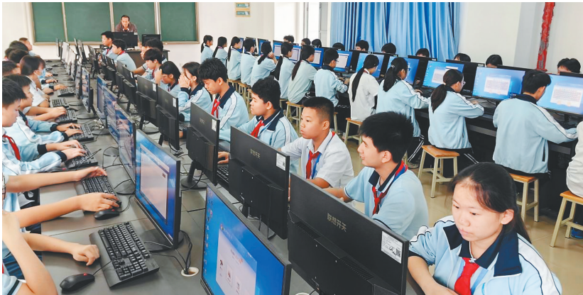
海口市第二中学学生在上信息化课程。

2025年，该民生实事项目共为全省1044所中小学建设7198间多媒体教室，配置触控一体机7198套，显著提升海南省中小学课堂质量与师生数字素养。