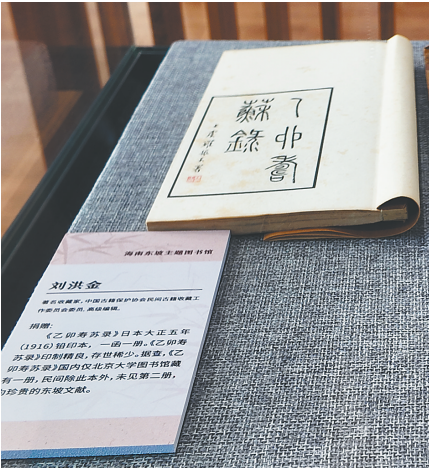
今年1月,海南东坡主题图书馆获赠珍贵东坡文献《乙卯寿苏录》。