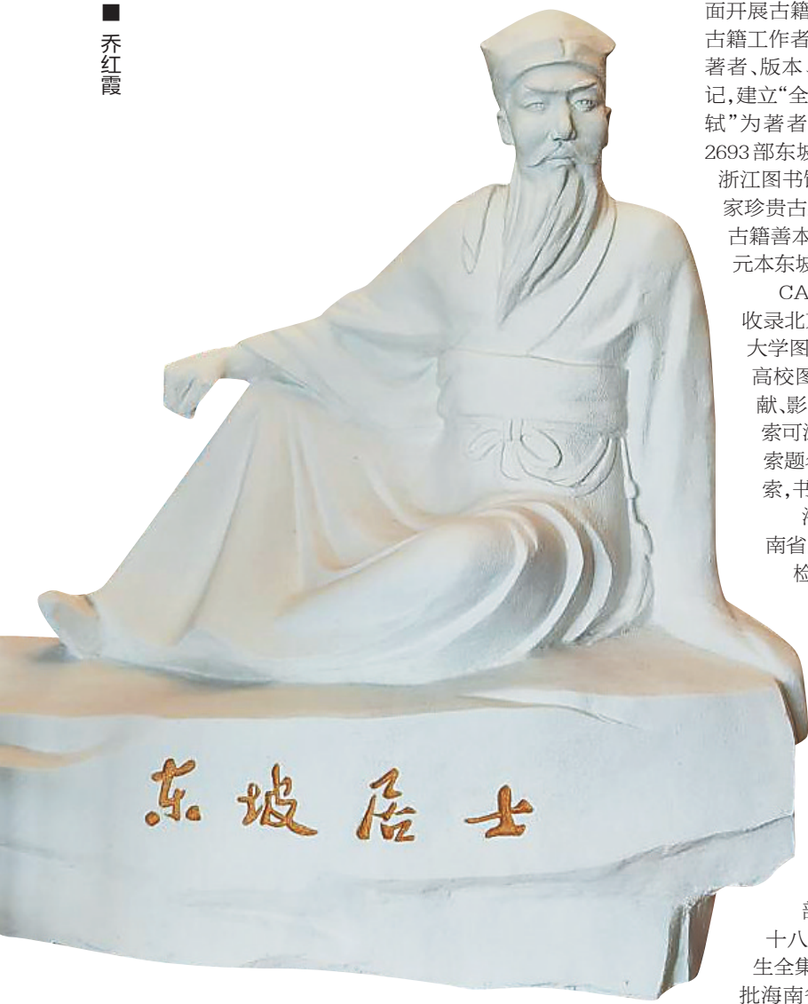
海南东坡主题图书馆里的东坡塑像。资料图