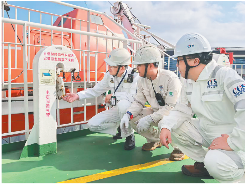
工作人员对琼州海峡客滚船开展安全检查。

海南海事局党组成员、副局长王欣铭介绍,去年春运客滚运输单日进出港峰值已达352艘次(平均每4分钟1艘次),预计今年船舶流量将进一步增长,海上运输更为繁忙。对此,该局已设立琼州海峡客滚运输监管专台,对客滚船实施“全旅程”跟踪和“点对点”安全提醒,确保客滚运输船舶安全状态随时可知可感。