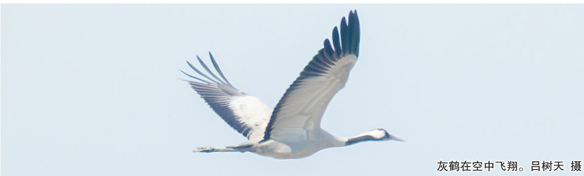
灰鹤在空中飞翔。

本报讯（海南日报全媒体记者孙慧）1月28日，东方黑脸琵鹭省级自然保护区与东方市资规局在联合巡护期间，工作人员观测并确认记录到国家二级保护野生动物——灰鹤的清晰影像和活动踪迹。 历史资料记载，灰鹤曾是海南人民常见的越冬候鸟。每年11月，它们南迁至此，停留至翌年3月北返。19世纪西方博物学家的笔记中，不乏它们成群栖息的生动记载。然而，进入20世纪后，其身影在海南日渐稀少，仅有零星标本留存——1964年在临高发现的两只个体，成为海南最后一次确切的记录。 灰鹤，亦称千岁鹤、玄鹤，属鹤形目鹤科，是一种体态优雅的大型涉禽。成鸟体长约95厘米至120厘