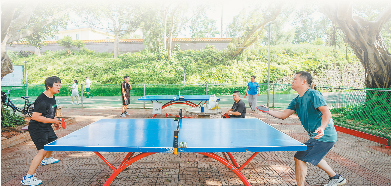
在海口金牛岭公园，市民们经常聚在一起，切磋球艺。

“乒乓”是乒乓球独有的脆响，也是海南最动人的街头旋律之一。海南的暖冬与烟火，本就与乒乓球的灵动相得益彰，这份运动的热忱，早已融入海岛的血脉，缠裹着夜市的烟火气，落在餐馆的檐角下；裹挟着邻里的笑语声，穿梭在社区的绿茵间；载着少年的追梦心，萦绕在一间间训练室里。