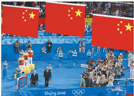
2008 年 8 月 23 日，三面五星红旗在北京大学体育馆升起，中国选手马琳、王皓、王励勤在北京奥运会乒乓球男子单打比赛中分获金、银、铜牌。