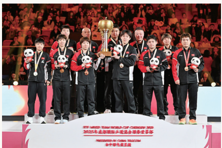
2025 年 12 月 7 日，中国队夺得国际乒联混合团体世界杯冠军。