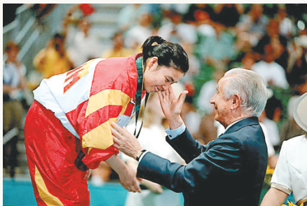
1996 年 7 月 31 日，邓亚萍获得第 26 届亚特兰大奥运会乒乓球女子单打金牌。