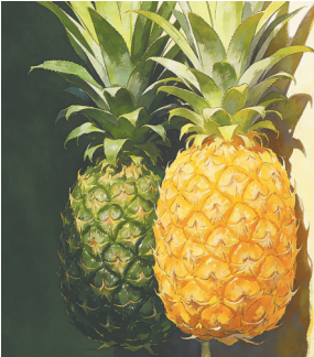
菠萝和风梨(右)是同宗同源“姐妹花”。

说到底,许多水果“双胞胎”的差异,要么源于品种改良,要么源于产地不同,要么源于人们的使用习惯。选购时,不用过多纠结名字,你喜欢吃的、适合自己的,就是最好的。📖