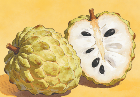
番荔枝,也叫释迦果、佛头果。本版图片均由徐珊珊AI绘制