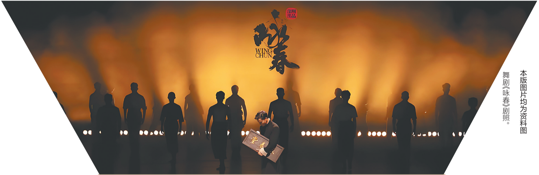
本版图片均为资料图 舞剧《咏春》剧照。

近日,广东深圳出品的舞剧《咏春》在加拿大多伦多迎来海内外巡演的第300场演出,引发了广泛关注。该剧自2022年12月在深圳首演后,便迅速“破圈”,2年时光,300场演出,走遍海内外,收获全网超3亿流量。所到之处,可谓飞沙走石。这是一场现实版的“功夫旋风”,一场极致的中式美学盛宴,同时也是一段现象级的文化传播之旅。 而近年来,舞剧《咏春》《侠影·咏春》、电影《叶问》《一代宗师》等众多文艺作品相继取材于咏春拳的传承故事,塑造了以叶问为代表的儒雅的“中国英雄”形象,于细微处凸显了中华优秀传统文化中的“侠之大者”。某种意义上,咏春拳算得上是镌刻在我国南派武术骨骼里的精神符号。