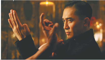
电影《一代宗师》剧照。

到清朝中期,习武成为佛山社会底层、普通百姓生活安宁的保障。随着经济发展,外来人口陡增,珠三角腹地练武之风日盛。20世纪二三十年代,阮奇山、姚才、叶问成为佛山“咏春三雄”,名噪一时。三人中,阮奇山年岁最长,姚才次之,叶问年纪最小。当年三人感情很好,常常一起练拳切磋,在姚才的桑基鱼塘边钓鱼。多年以后,叶问去往香港开宗立派广收门徒,被称为“叶