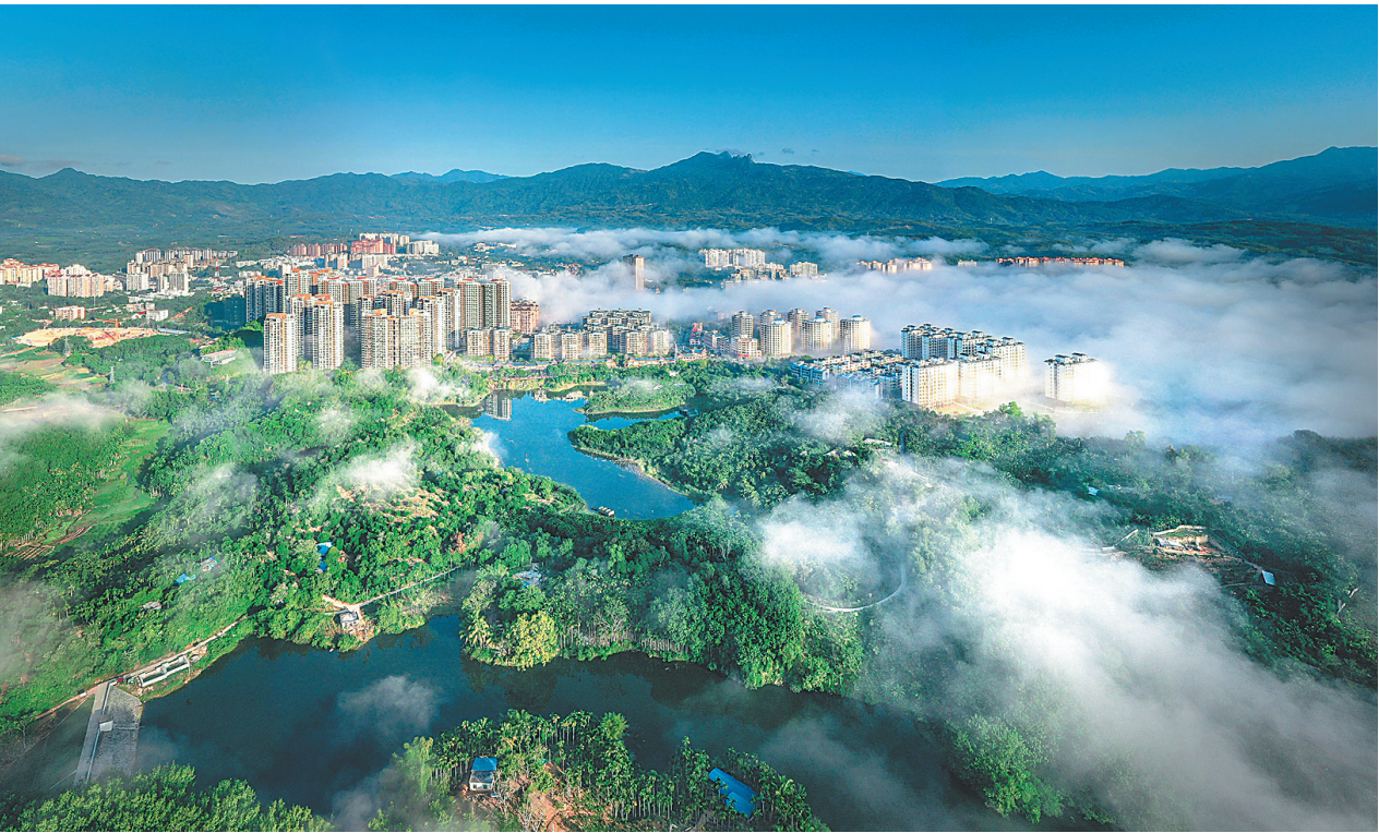
航拍青山环抱中的保亭。

今年是海南自由贸易港全面实施封关运作开局之年，也是保亭抢抓机遇、乘势而上的关键一年。站在新的历史起点上，保亭将以此次国际大会为契机，汇聚全球智慧、凝聚合作共识，奋力在气候与健康协同治理领域探索一条兼具保亭特色、可复制推广的发展新路径，为海南自贸港建设注入绿色健康动能，为全球气候治理贡献中国县域力量。