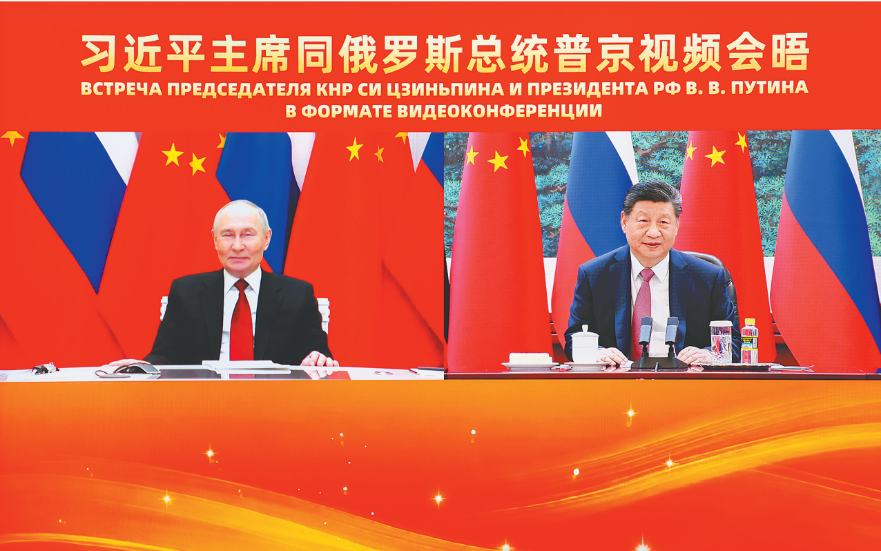
2月4日下午，国家主席习近平在北京人民大会堂同俄罗斯总统普京举行视频会晤。

新华社北京2月4日电(记者杨依军 孙奕)2月4日下午，国家主席习近平在北京人民大会堂同俄罗斯总统普京举行视频会晤。