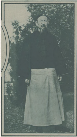
1931年时的张难先。