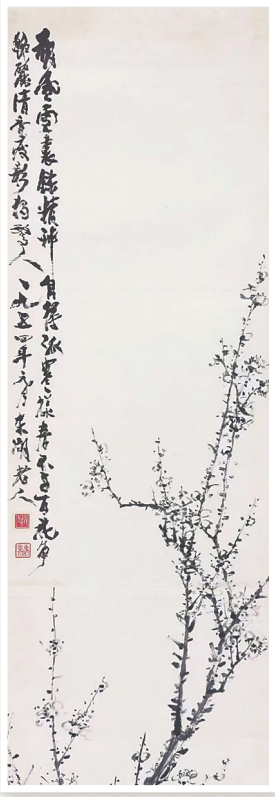
张难先的画作。 资料图