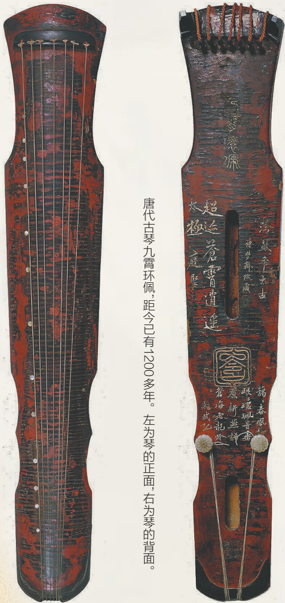
唐代古琴九霄环佩，距今已有2000多年。左为琴的正面，右为琴的背面。

白居易有诗云：“七弦为益友，两耳是知音”，古琴的琴弦，一端是历史，一端是未来，每一次拨动，都向世界奏响着中国的声音。