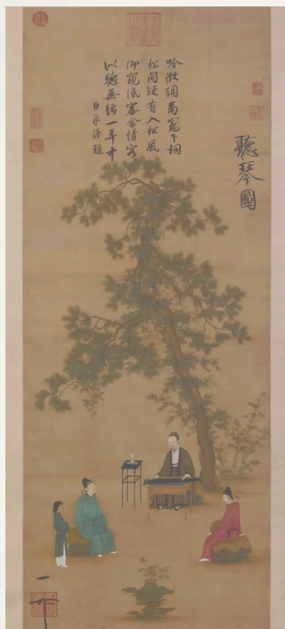
宋徽宗赵佶的《听琴图》。