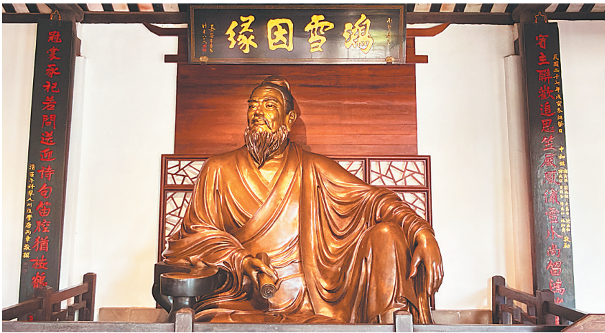
儋州东坡书院里唐丙章所作的楹联。

姓氏的宗祠对联，溯源联是常见类型。明代海南进士许子伟曾为琼山大坡许氏宗祠作对联：“源从太岳规模远，派出高阳世系长。”其中的“太岳”“高阳”是许姓源头，许子伟以此联