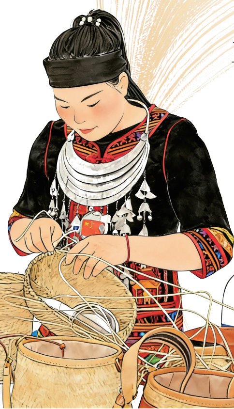
青年传承人展示藤竹编织技艺。

近日，以“非遗在社区，三亚更有戏”为主题的系列活动暨三亚市非遗小馆开馆仪式在崖州古城举行。全市首批七家集展示、传习、体验于一体的非遗小馆正式投入运营，免费向市民游客开放。