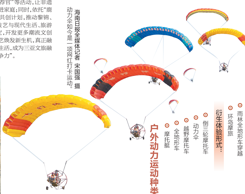
户外动力运动种类