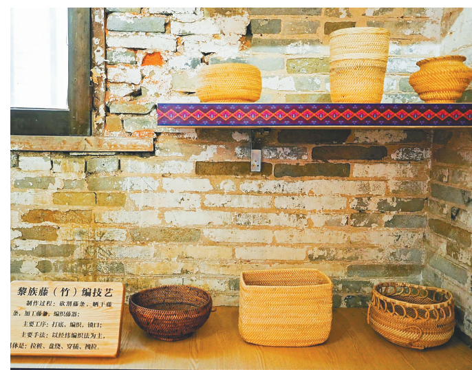
黎族藤竹编作品 崖州小馆里展陈的

开馆仪式当天，三亚非遗流动宣传车同步亮相，在社区广场、商圈、景区开展快闪活动，通过技艺教学、沉浸式体验让非遗融入现代生活场景。现场的非遗传承人访谈、手工体验等活动，让市民近距离感受到传统文化魅力。