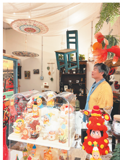
海口滨海新村的慢得社区一隅。

这条巷子,以前是什么样,以后还是什么样。只是巷子里的脚步声,比以前多了些,也年轻了些。而这,大概就是最好的更新——不赶时间,也不被时间赶。像墙角的三角梅一样,慢慢地,自在,在,往该去的地方爬。爬得久了,整面墙都是风景。