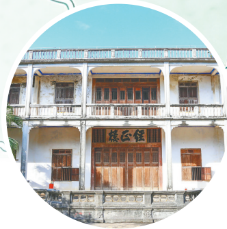
文昌溪北书院。资料图