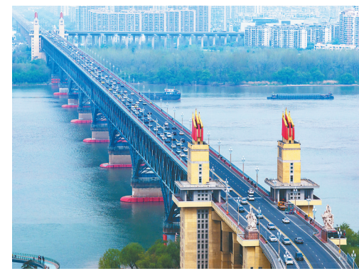
4月6日，车辆在南京长江大桥上行驶。