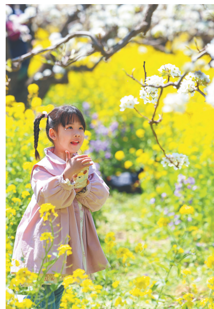
4月6日，小朋友在河北省晋州市周家庄乡梨园赏花游玩。

对接春日出行需求，多地发出一道趟开往春天的赏花列车。西安铁路局结合春季文旅资源，开行蒲城梨花专列、汉阴油菜花专列；往返于郑州、洛阳两地的赏花专列G8000次列车，带游客赏牡丹、品美食；昆明铁路局开行“游遍神州系列”特色赏花专列，提供赏花精品线路。