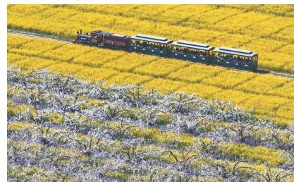
4月6日，游客乘观光小火车从河北省晋州市周家庄乡第九生产队梨园旁经过。

“如今的清明，不再局限于传统的民俗季节性活动，而是展现出丰富的出游选择与全新的消费场景，正逐步成为融合踏青赏春、休闲游玩、体验风物于一体的全民春日盛会。”云南旅游职业学院教授伍乐平说。