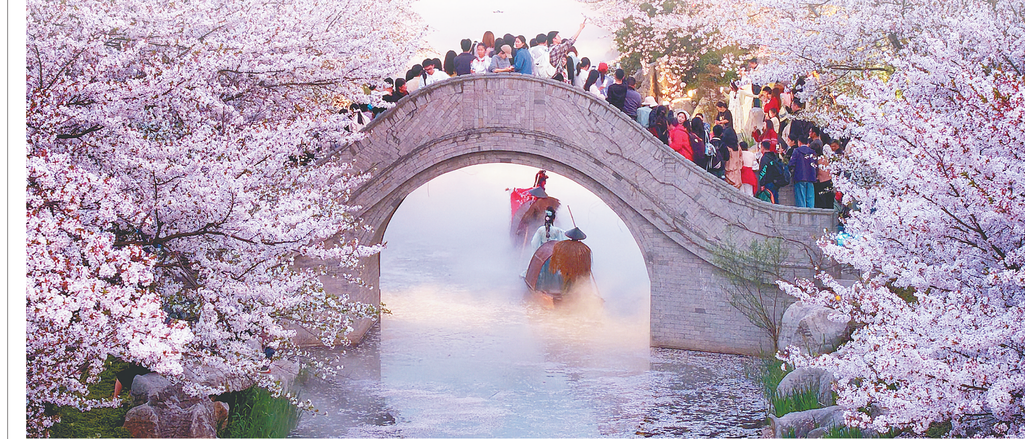
4月5日，游客在江苏南通洲际梦幻岛欣赏樱花河。

清风拂绿野，正是踏青时。清明时节，各地市民游客纷纷走出家门，或泛舟水上，游览两岸繁花竞放；或亲子骑行，慢赏沿途花海；或搭乘列车，看窗外春色浩荡铺展……踏青赏春不再拘泥于终点，一路奔赴皆是风景，沿途繁花尽可赏，生动展现出活力澎湃、暖意融融的流动中国。