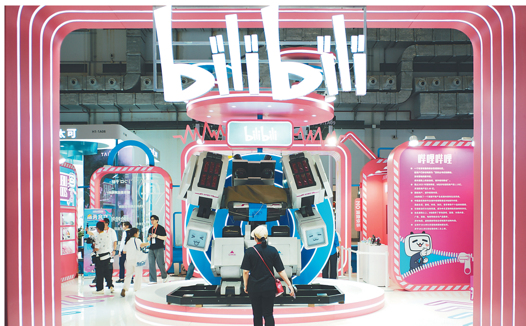
4月13日,人们走进第六届消博会科技消费展区哔哩哔哩展台。

在新的时代机遇中,消博会正以一场场密集的首发首秀,书写引领消费潮流的新答卷。(本报海口4月13日讯)