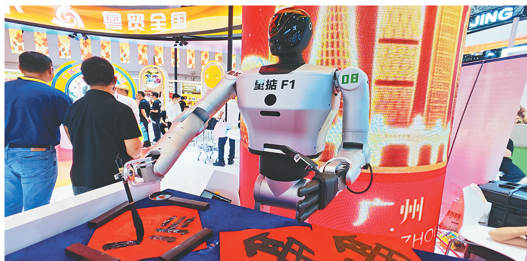
机器人在消博会上写书法。