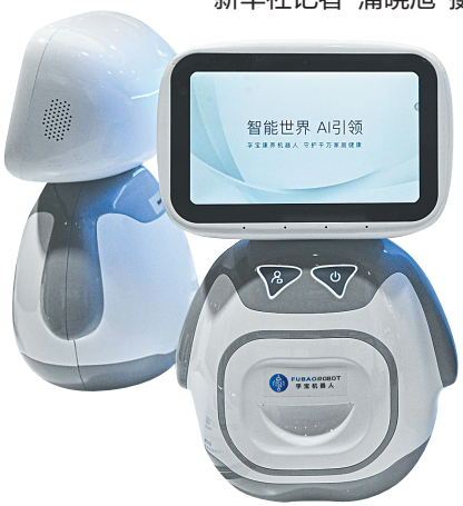
▼消博会上展示的康养陪伴机器人。