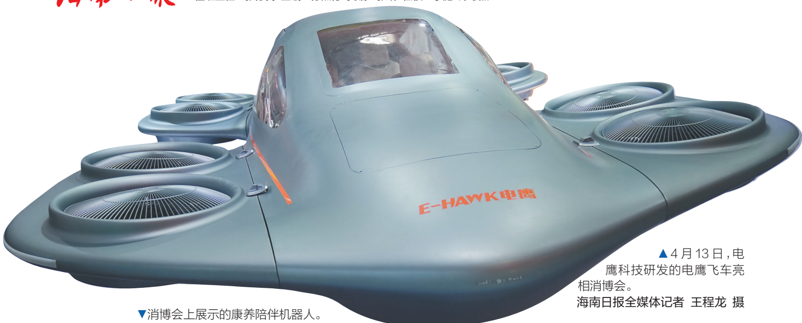
▲4月13日,电鹰科技研发的电鹰飞车亮相消博会。