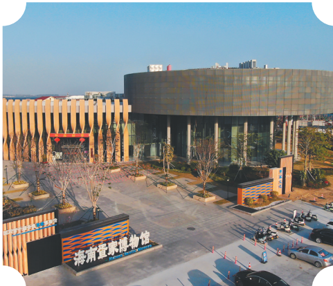
海南疍家博物馆。