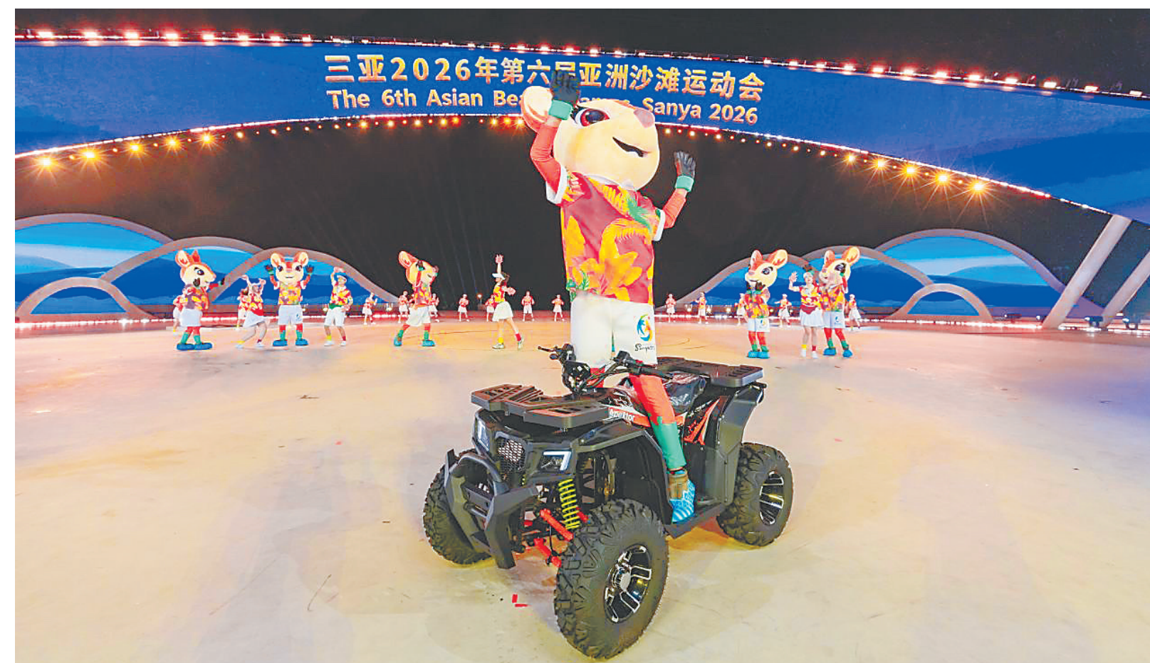
“亚亚”将担任开幕式“主人公”

息发布等模块,实现游客诉求快速响应、闭环管理。科学调配运力资源,优化热门景区、赛事场馆周边公交线路,加密班次、延长运营时间,重点强化海岛景区船舶运力保障,新增客位船舶并启用岛上码头提升通行效率。加密机场、车站等重点区域公交与出租车运力,指导租车企业增设取还车点位,实现“落地即取、就近还车”。全市在机场、车站、景区、赛事场馆等关键区域设置便民服务站,提供行李托管、信息咨询、应急帮扶等服务,以贴心服务传递城市温度。