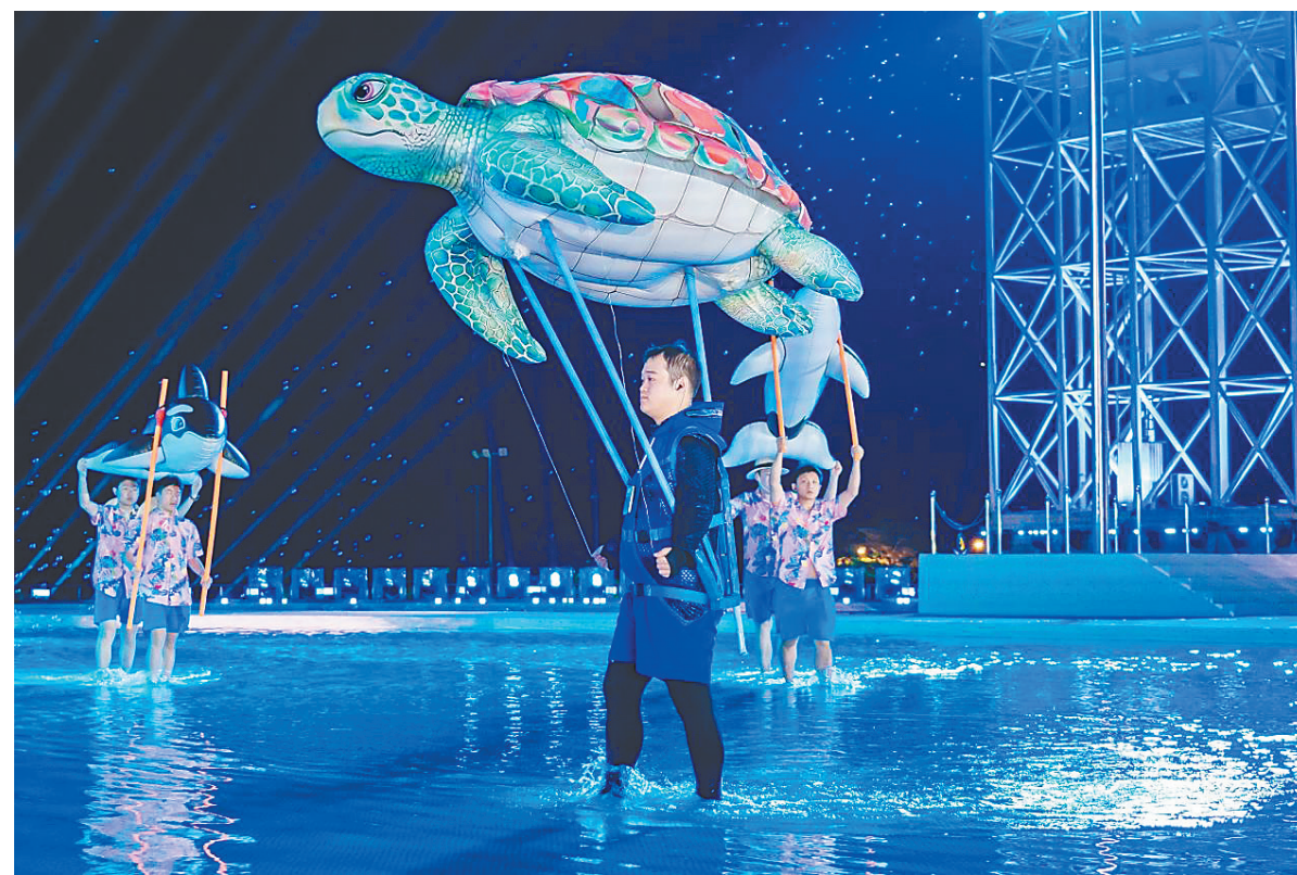
三亚亚沙会开幕式彩排现场。

此外,开幕式的焰火与点火环节也备受期待。总制作人王锐祥透露,演练中呈现的焰火只是“序曲”,真正的好戏将在4月22日开幕式当天登场。尤其在点火环节,导演团队将环保科技与虚拟成像技术创新结合,届时观众将看到一场震撼而惊艳的亚沙会焰火盛典。