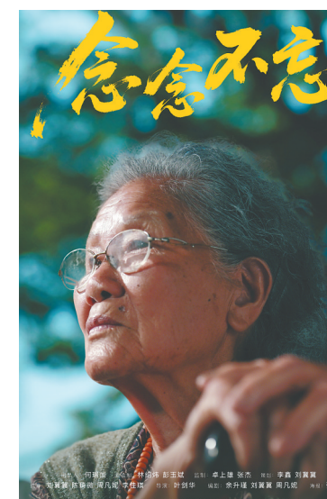
微电影《念念不忘》海报。

2025“理响中国”党的创新理论网络传播精品征集展播活动由中央网信办网络传播局、中央党校(国家行政学院)科研部、中央党史和文献研究院第七研究部、中国社会科学院科研局联合主办。