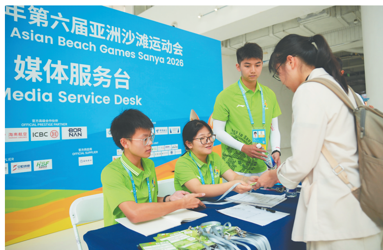
4月17日,三亚亚沙会运动员村志愿者为相关人员办理证件。

文化广场和旗帜广场位于国际区中心。旗帜广场上整齐展示着所有参赛奥委会的旗帜,象征着亚洲体育健儿的团结与友谊。紧邻的文化广场将在赛时举办8场特色文化演出,首场“中华国粹专场”将于4月19日上演。此外,C厅展示厅内设有OCA安全教育宣传区、反兴奋剂拓展教育和海南非遗展示互动体验区,运动员可近距离体验黎锦、椰雕、黎陶等非物质文化遗产,感受