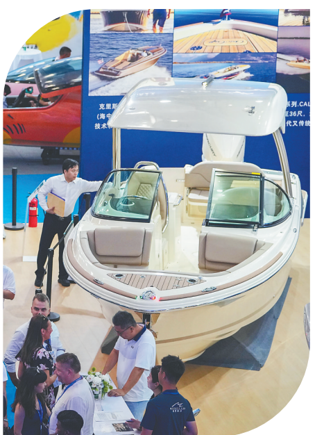
4月15日，第六届消博会三亚国际游艇分展区在三亚国际游艇中心开幕，图为观众在展馆内参观游艇。