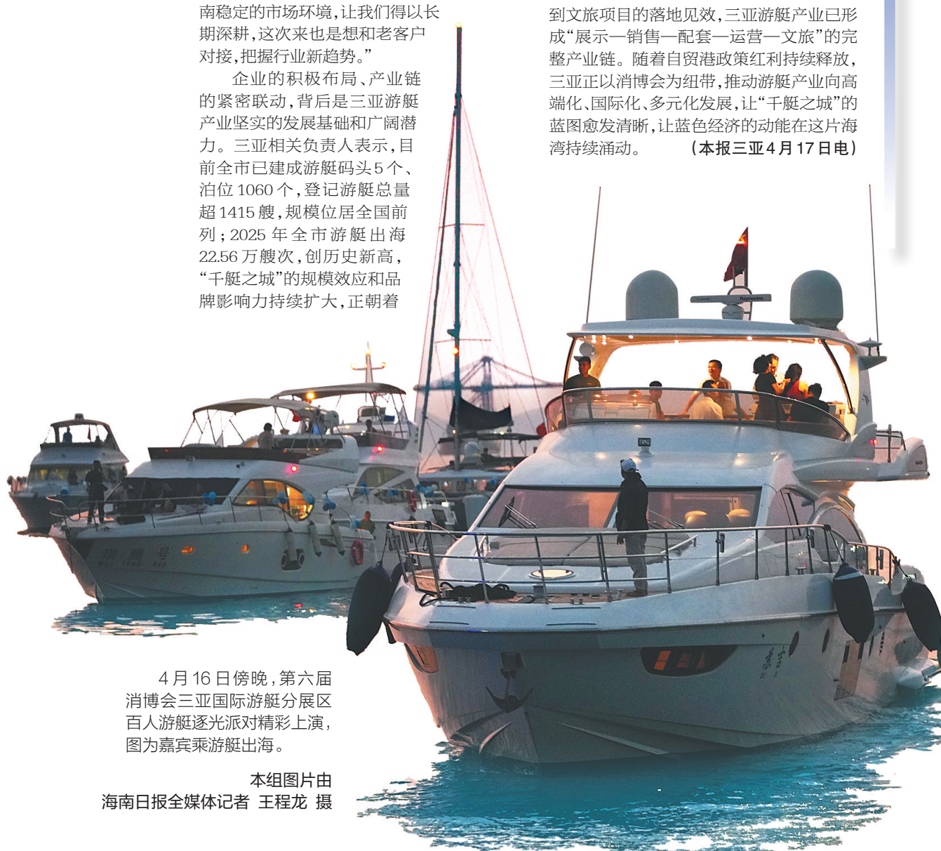
4月16日傍晚，第六届消博会三亚国际游艇分展区百人游艇逐光派对精彩上演，图为嘉宾乘游艇出海。