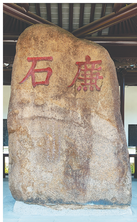
江苏苏州文庙中的“廉石”。 资料图

岁月无声，唯石能言。如今，苏州市纪委、监委官网域名为“廉石网”，报纸有“廉石”专版，电视台有“廉石”专题，各种宣传活动、文艺演出也常以“廉石”冠名……千年清风熔铸的“廉石”精神被广泛弘扬、传播，在崇廉尚洁、推动社会进步等方面依然发挥着重要作用。