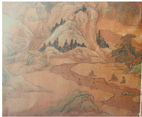
北京故宫博物院收藏的明代文徵明《兰亭修禊图》。

历史上最著名的一次“曲水流觞”，当数晋代大书法家王羲之在会稽兰亭与友人的聚会。永和九年(353年)三月初三上巳日，王羲之偕同亲友谢安、孙绰等四十一人，在兰亭修禊，还举行了“曲水流觞”活动，饮酒赋诗，成为千古佳话。恰如王羲之在《兰亭集序》中写道：“永和九年，岁在癸丑，暮春之初，会于会稽山阴之兰亭，修禊事也。群贤毕至，少长咸集，此地有崇山峻岭，茂林修竹，又有清流激湍，映带左右。引以为流觞曲水，列坐其次。虽无丝竹管弦之盛，一觴一咏，亦足以畅叙幽情……”这次兰亭雅集，虽然也举行修禊的祭祀仪式，但主要通过“曲水流觞”活动，突出咏诗论文、饮酒赏景，因而大大冲淡了原有的民俗色彩。晋以后，“曲水流觞”活动逐渐传到民间。而明代画家文徵明的《兰亭修禊图》，就是据此以绘画的形式，艺术地再现了兰亭修禊别开生面的场景，是对“曲水流觞”以绘画的形式进行传承。