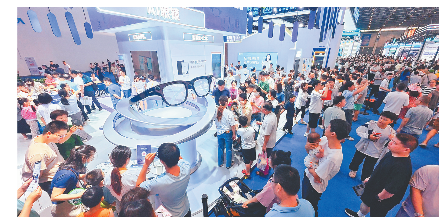
四月十八日,第六届国际消费品博览会迎来闭幕日,海南国际会展中心展馆内人头涌动。