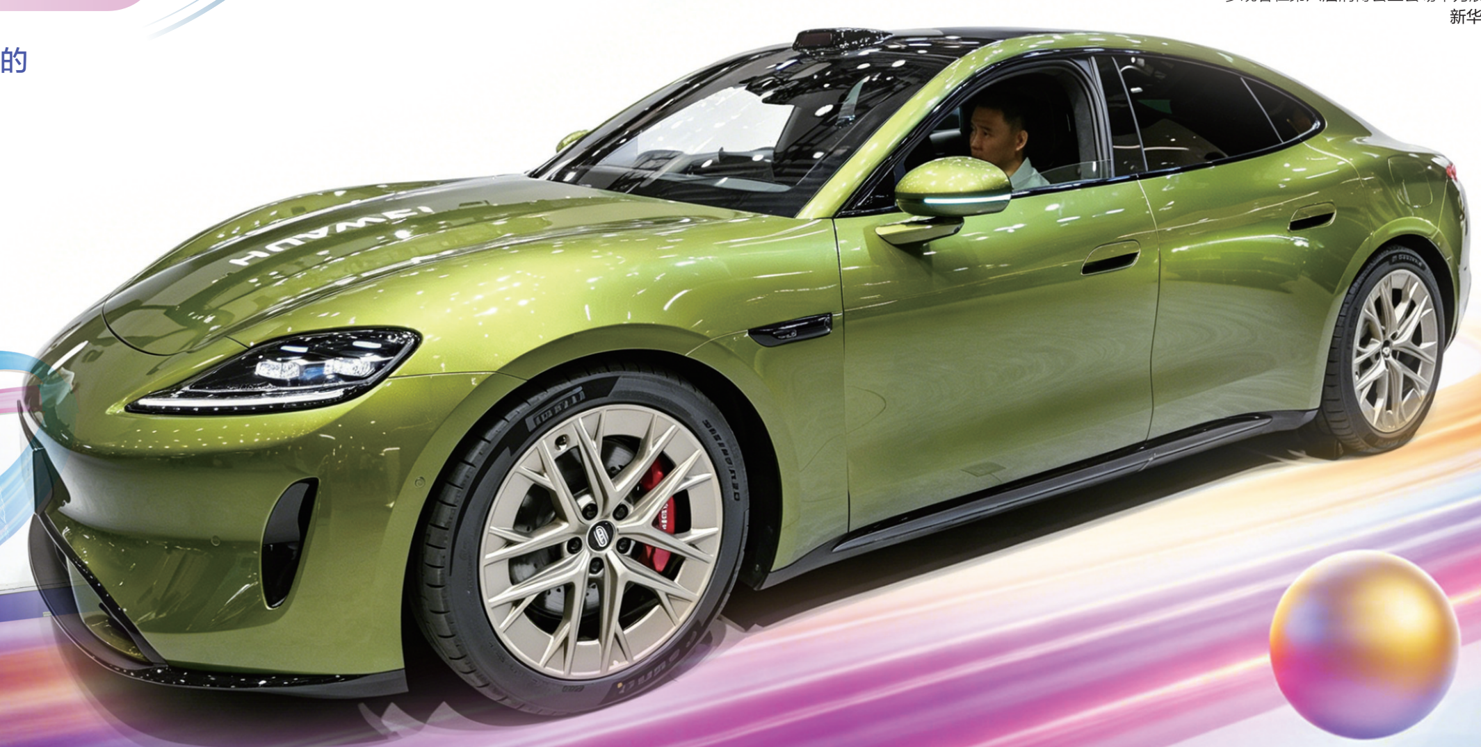
参观者在第六届消博会主会场华为展台体验汽车性能。