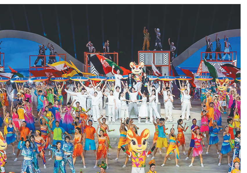
亚沙会开幕式彩排中的主题歌演场景。

盛会将启，悠扬歌声踏浪而来，以青春之名赴天海之约，向世界展现活力亚沙、青春三亚。