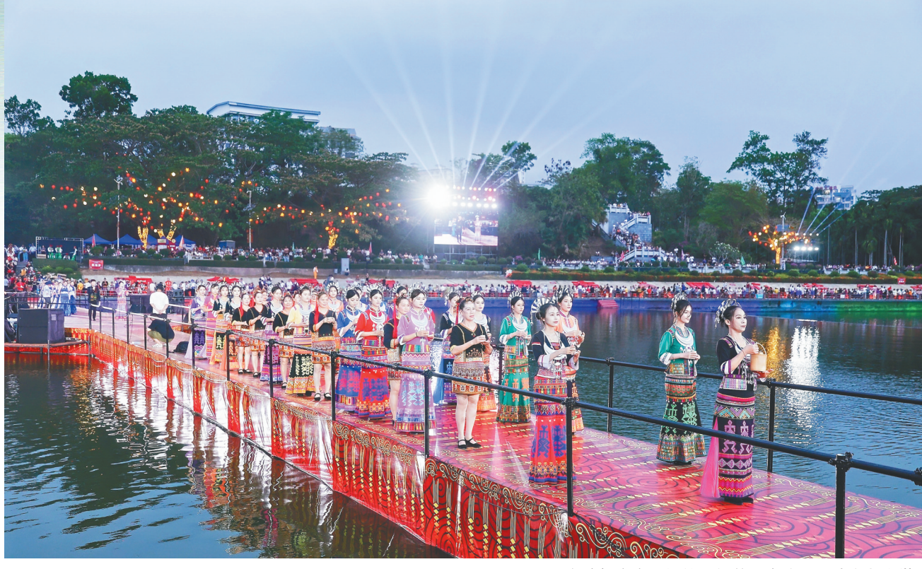
白沙长桌宴现场的民俗节目表演。