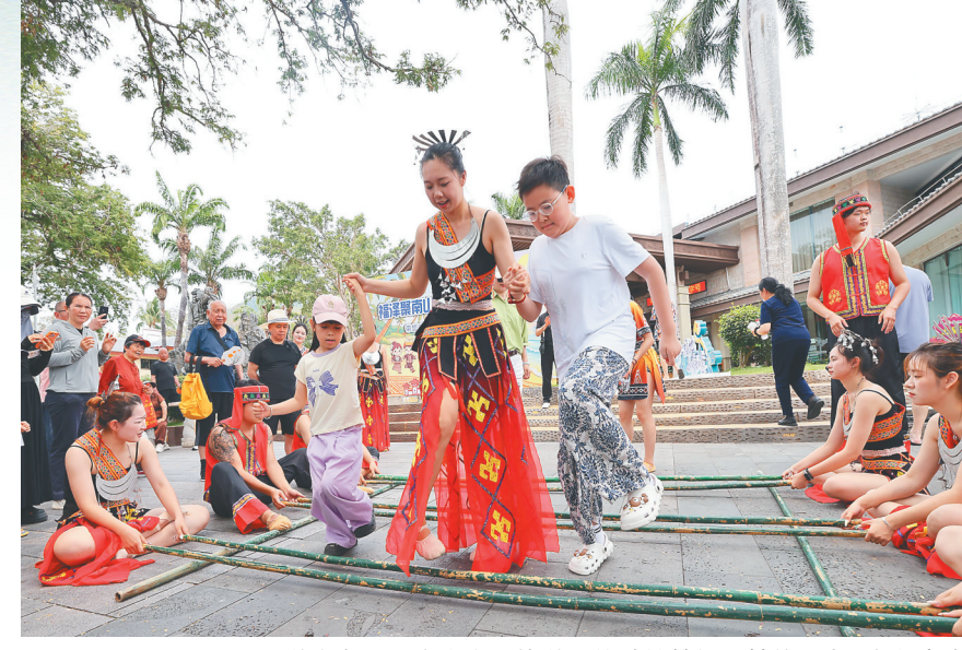
游客在三亚南山文化旅游区体验竹竿舞。