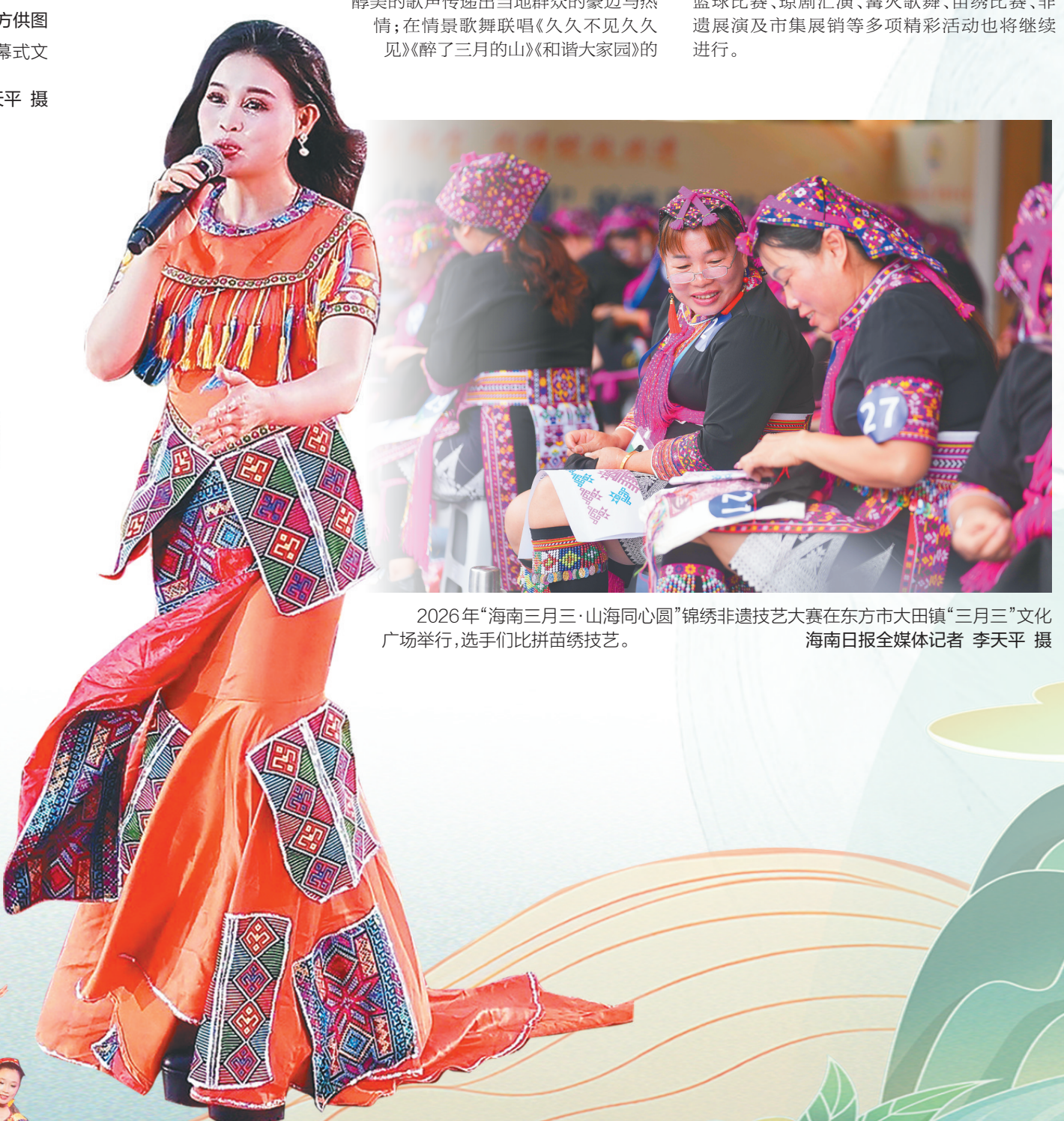
2026年“海南三月三·山海同心圆”锦绣非遗技艺大赛在东方市大田镇“三月三”文化广场举行,选手们比拼苗绣技艺。

本报嘉积4月19日电(海南日报全媒体记者 王子豪 通讯员林静)昼长莺飞四月天,春风十里醉琼海。4月19日上午,2026年“海南三月三·山海同心圆”琼海分会场开幕式在风光旖旎的会山仙境热闹上演。各族群众齐聚苗绣文化广场,共庆传统佳节,共享民族文化盛宴。 开幕式现场处处绽放苗红,沉浸在一片欢乐的海洋中。活动在大型舞蹈《北京喜讯到边寨·同心共筑中国梦》中拉开帷幕。随后,一系列极具民族风情的节目轮番登场:情景演唱《立春》唱出了对春天的美好憧憬;舞蹈《锦绣情长》将黎锦与苗绣非遗技艺搬上舞台;《苗家敬酒歌》用醇美的歌声传递出当地群众的豪迈与热情;在情景歌舞联唱《久不见久久见》《醉了三月的山》和《家园园》的动人旋律中,全场气氛被推向高潮。 除了精彩纷呈的文艺演出,文旅互动体验同样拉满。活动现场特别推出了“叶辣咪打卡会山·集邮有礼”互动环节。备受瞩目的会山风光明信片首次完整亮相,这套明信片精心收集了万泉河谷、雨林溯溪、粉车街、放豚苗寨、白马岭、瑶安胶园、榴头新村、油茶树王等八处绝美风光。与此同时,会山旅游地图也在当日正式发布,并在主会场设立了专题展示栏,方便广大游客按图索骥,深度畅游探秘会山之美。 据悉,本次琼海分会场活动除开幕式外,篮球比赛、琼剧汇演、篝火歌舞、苗绣比赛、非遗展演及市集展销等多项精彩活动也将继续进行。