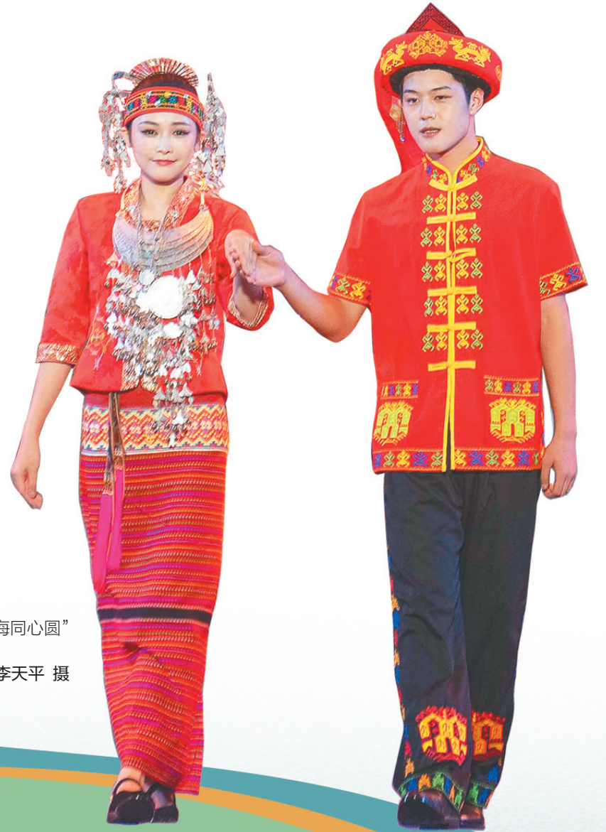
2026年“海南三月三·山海同心圆”主会场开幕式文艺演出现场。

本报讯(海南日报全媒体记者 李艳斌)4月19日(农历三月初三),三亚各大景区紧扣传统佳节特色,精心打造多元民俗文旅活动,持续丰富节日旅游产品供给,让市民游客在沉浸式体验中感受民俗文化魅力,激活假日文旅消费活力。 在三亚丝路欢乐世界,首届“丝路杯”竹竿舞大赛举行,千余名来自企业、民俗艺术团、校园社团的参与者身着特色民族服饰同台竞技,竹竿敲击声、民族乐声与游客欢笑声交织,千人共跳竹竿舞的场面,尽显本土民族文化的生机与活力,也让全民同乐的民俗氛围拉满。 为全方位满足游客节日游玩需求,三亚丝路欢乐世界于4月17日至20日推出“丝路传韵 同心筑梦”“三月三”活动,打造六大主题板块,推出30余场特色演艺及互动体验活动,服饰秀、三色祈福、篝火狂欢、黎寨欢歌等民俗项目轮番上演,搭配特色美食市集、游乐设施优惠、餐饮折扣等暖心福利,全方位升级游客游玩体验,吸引大批游客前来打卡游玩。