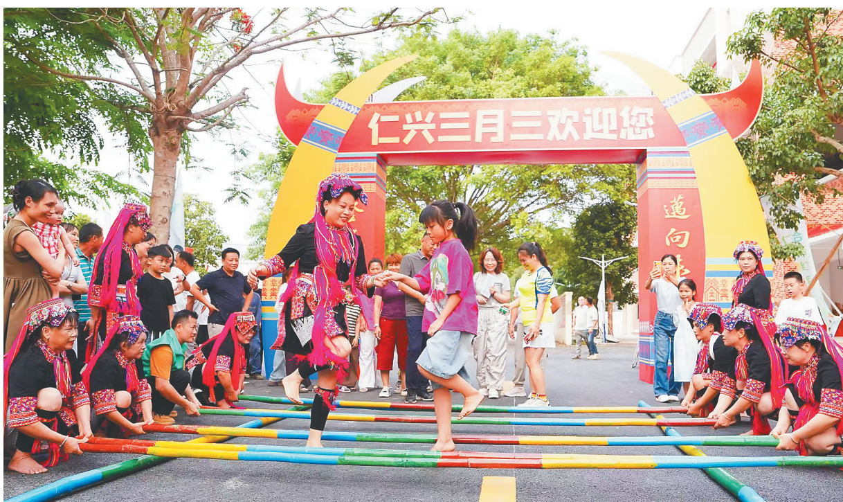
各地群众体验竹竿舞。

此次走秀将生态好物与文创创新相结合，推广了仁兴特色产品，助力“文化澄迈·十二乐章”活动让更多人了解仁兴、爱上仁兴。