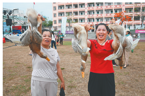
居民体验套鸭子趣味活动。