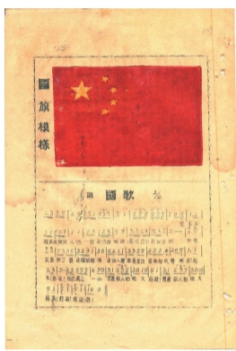
《新民主报》上关于国旗、国歌的内容。资料图