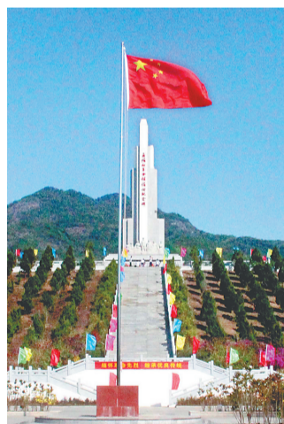
五指山革命根据地纪念馆飘扬的五星红旗。

五指山革命根据地地位于海南岛五指山地区，其范围大致包括民国时期白沙、保亭、乐东三县的大部分地区。1948年3月至1950年4月间，中共琼崖区委、琼崖临时民主（人民）政府和琼崖纵队司令部领导机关驻白沙县毛贵乡（今五指山市毛阳镇毛贵村），毛贵也成为海南解放战争后期的指挥中心。这里是海南第一面五星红旗升起的地方。纪念馆建有纪念碑及浮雕、纪念馆广场、烈士陵园、历史陈列馆等。