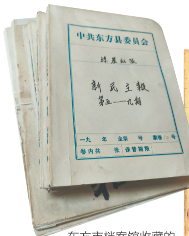
东方市档案馆藏的《新民主报》。