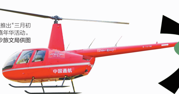
4月18日,白沙首次推出“三月初三·飞越雨林”飞行主题嘉年华活动。