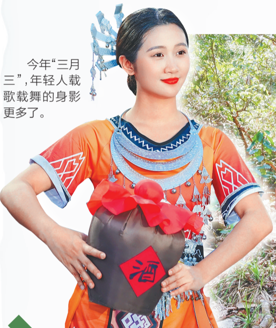
今年“三月三”,年轻人载歌载舞的身影更多了。