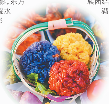
黎族、苗族美食三色饭。