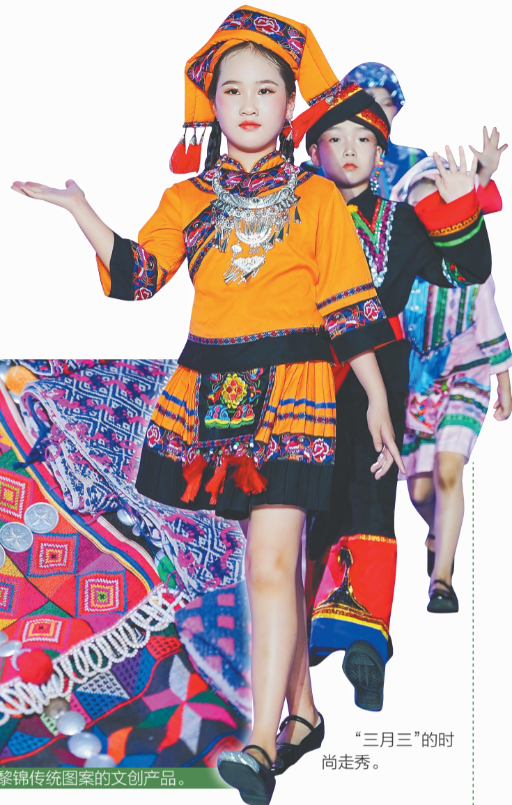
“三月三”的时尚走秀。