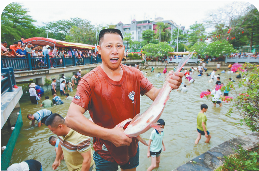
4月18日,市民游客在白沙文明湖参与“三月三”摸鱼活动。