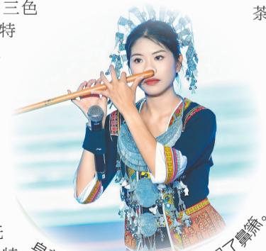
身着黎族服饰的年轻女孩吹起了舞箫。

晚上,当黎族传统歌舞串烧到探戈和魔术时,台下的观众跟着节奏抖起了腿。活动结束后,社交平台上“海口三月三”的话题阅读量蹭蹭往上涨。“我希望‘三月三’是所有人都愿意参与的全民活动。”刘雯说,她的初心,是守住文化根脉,用潮流表达让更多人爱上传统民俗。