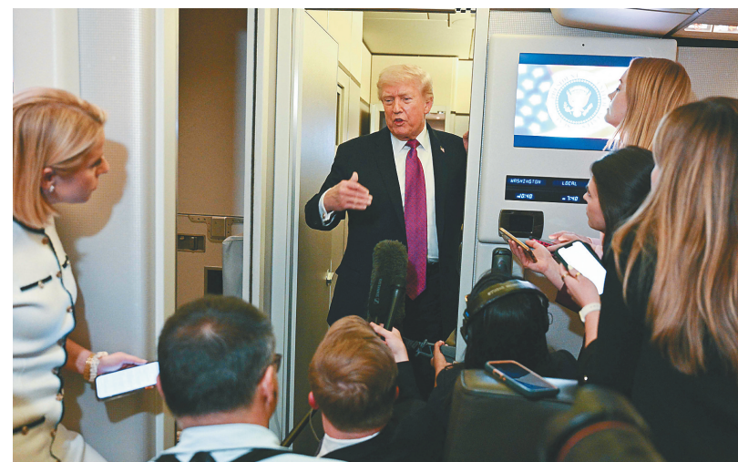
美国总统特朗普在飞往马里兰州安德鲁斯联合基地的总统专机“空军一号”上接受媒体采访。（资料图）

民主党猛攻、民众不满、经济承压——美国媒体说，共和党目前选情不妙、“神经紧绷”。一些共和党人私下