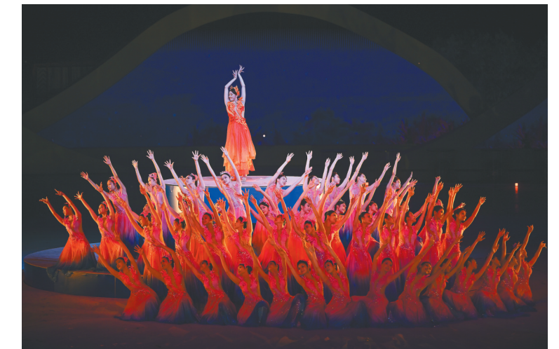
开幕式文艺表演第二篇章《深海逐梦》。