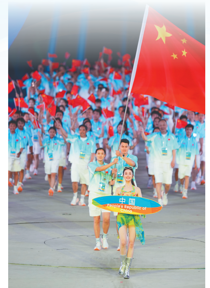
中国体育代表团在开幕式上入场。