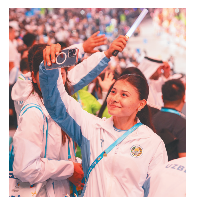
参加开幕式的运动员拍照留念。