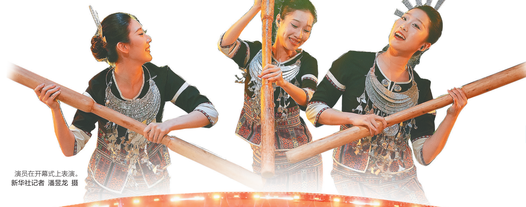
演员在开幕式上表演。