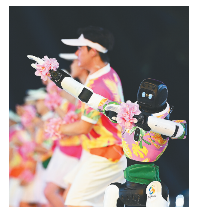
机器人与演员在开幕式上表演。