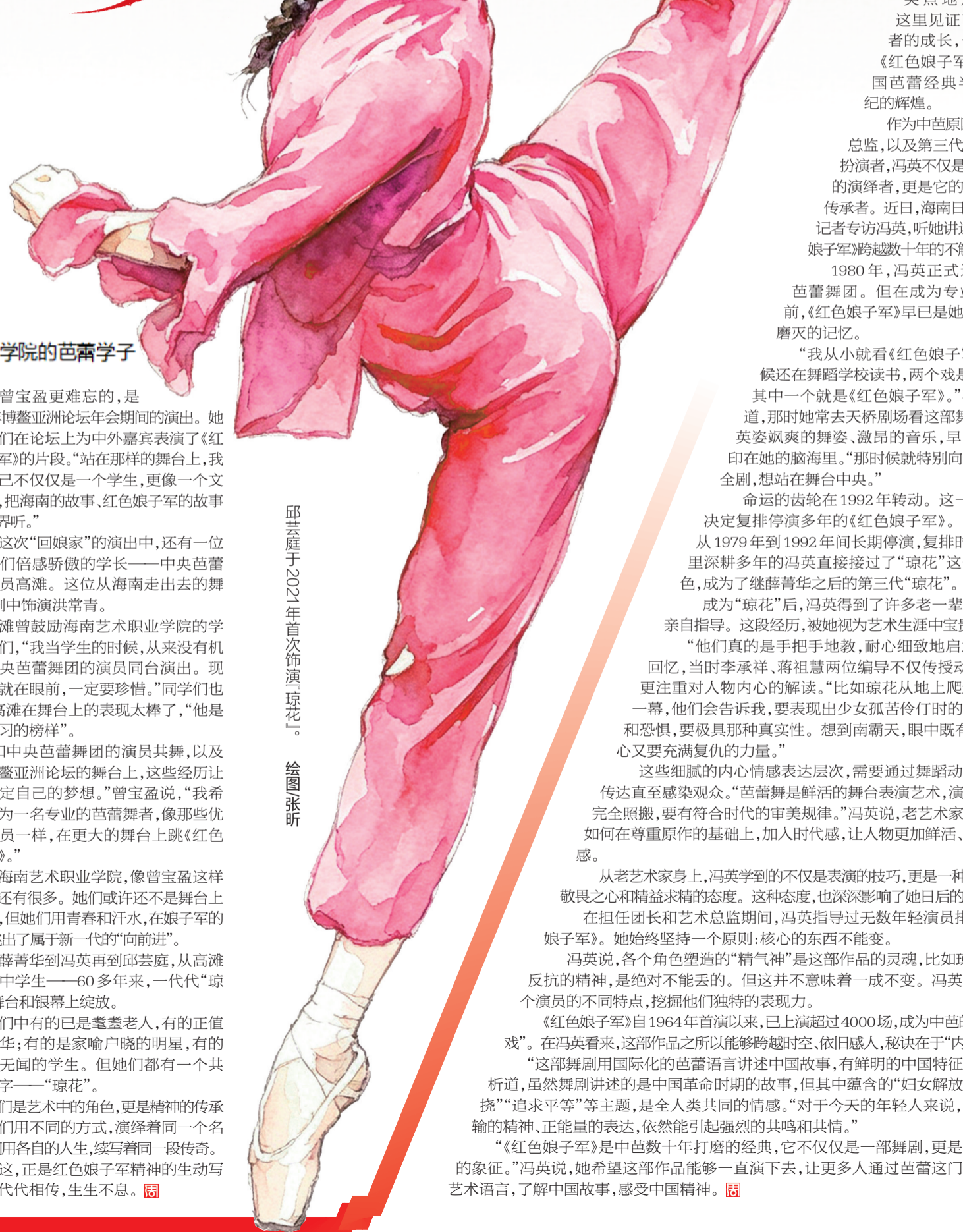
邱芸庭于2021年首次饰演“琼花”。 绘图张昕