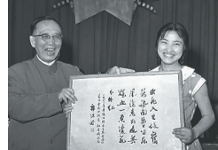
郭沫若在首届电影“百花奖”颁奖仪式上向《红色娘子军》女演员祝希娟(右)颁奖(奖品为他的亲笔题词)。