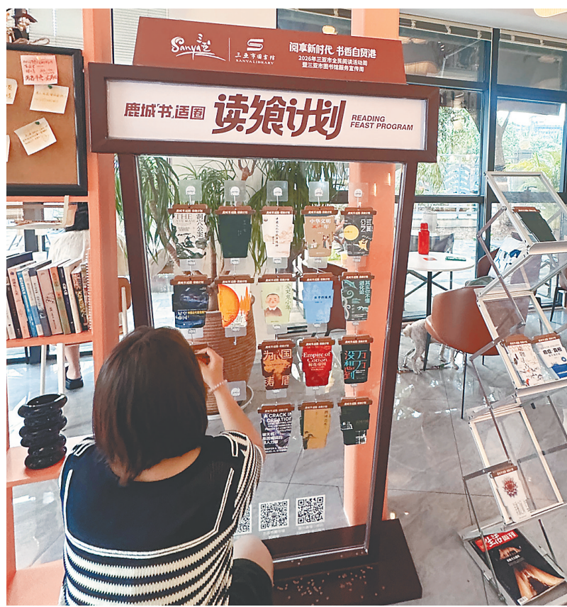
▲ 三亚一咖啡厅投放的电子书卡。 ▼ 儋州世界读书日主题文艺展演现场。

当前,三亚市全民阅读活动周系列活动正在开展,陆续推出三亚市图书馆“‘躺’读计划”“鹿城寻迹”户外研学科普活动、“鹿”营会·崖州“共读一小时”活动、“鹿城‘书’适圈”读飨计划,以及多个丰富多彩的线上读书分享活动,感兴趣的市民读者可关注“书香三亚”“三亚市图书馆”微信公众号参与活动,共赴书香之约。