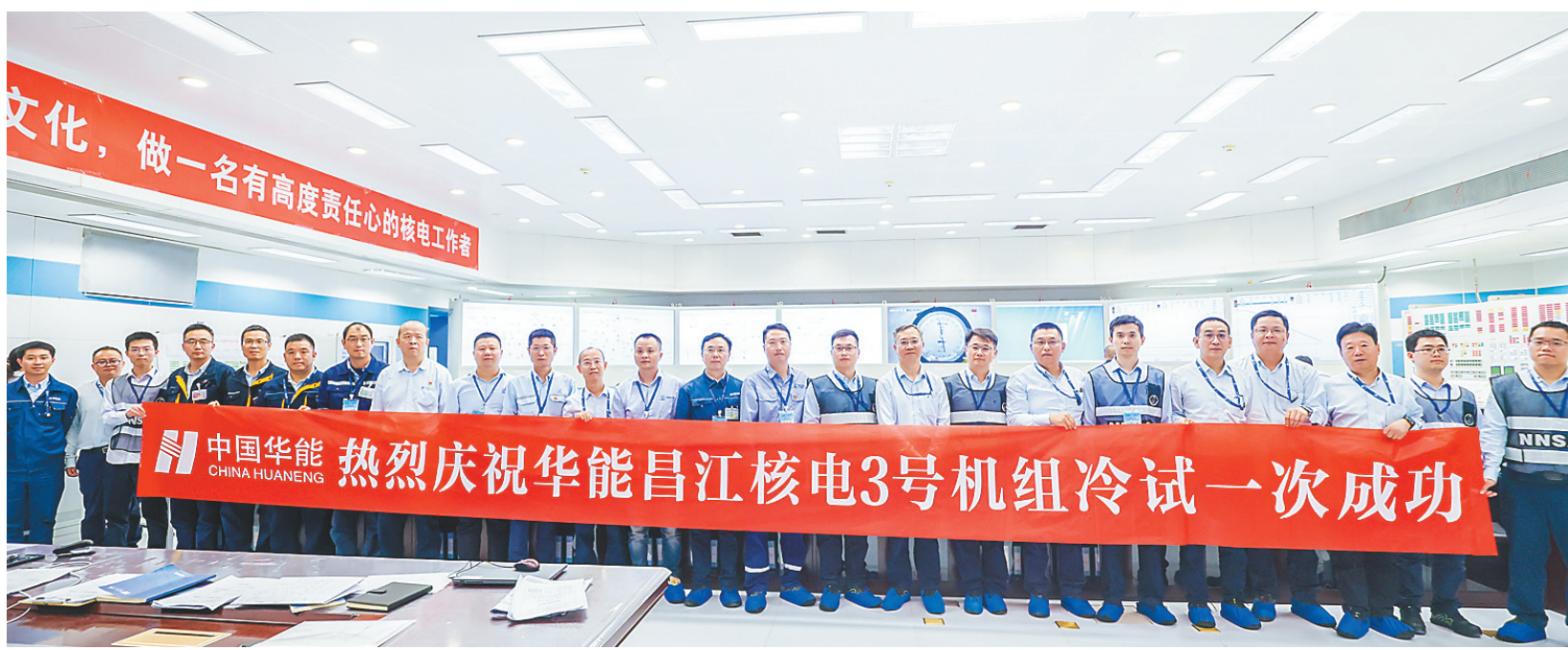
全国五一劳动奖状获得者单位:华能海南昌江核电有限公司。