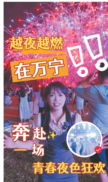
越夜越燃 在万宁 奔赴一场青春夜色狂欢