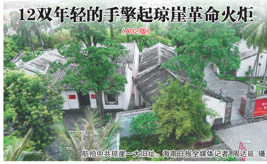
航拍中共琼崖一大旧址。