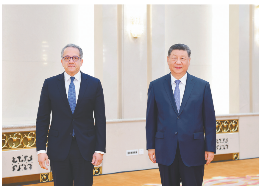
五月十二日下午，国家主席习近平在北京人民大会堂会见联合国教科文组织总干事阿纳尼。

新华社北京5月12日电(记者温馨)5月12日下午，国家主席习近平在北京人民大会堂会见联合国教科文组织总干事阿纳尼。