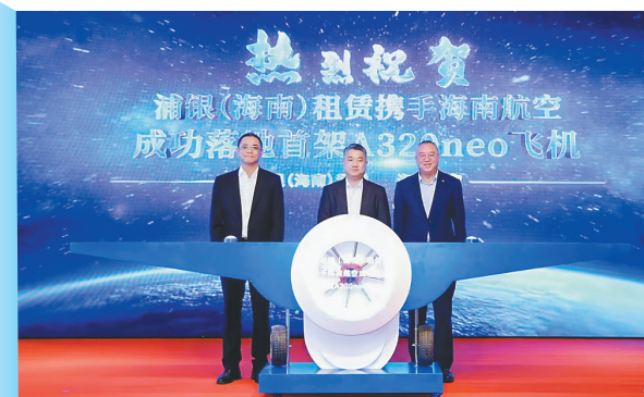
2025年12月26日, 浦发银行-中国太保-国泰海通“跨境荟”海南自贸港服务方案发布。

集团协同作战更是让创新的“单点突破”迅速转化为“规模效应”。在总行提级成立的海南自贸港建设业务推进工作小组领导下, 海口分行协同浦银金租在海南设立金融租赁行业国内首家管理型项目公司, 协同浦银理财参与省属国企债券投资, 联动境内外分