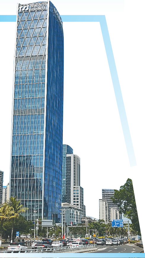
浦发银行海口分行大楼。

十三载同行, 见证的是沧海桑田, 沉淀的是服务实体、深耕本土的定力。如今, 站在海南自贸港全岛封关运作的新征程上, 浦发银行海口分行正以更稳的根基、更强的锐气、更暖的底色, 交出一份与时代同行的金融答卷。