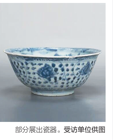
部分展出瓷器。受访单位供图