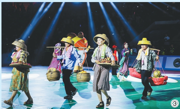
① 现场观众热情为球队加油呐喊。 ② 五月十六日,全国村排赛场外,山海甄选·丰收市集热闹非凡。 ③ 比赛间隙,澄迈当地农民展示各类物产。