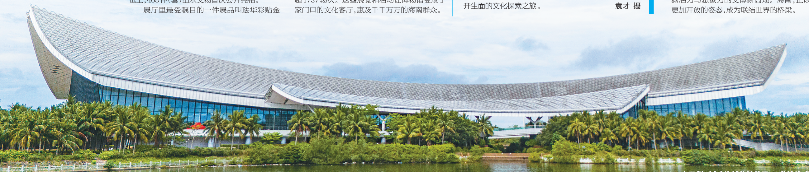
中国(海南)南海博物馆外景。蒙钟德 摄