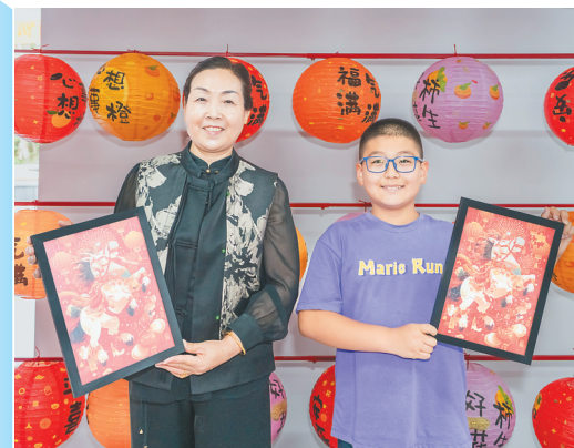
市民游客在海南省民族博物馆制作民俗手作。

博物馆在用自己的方式与人们相遇。2025年,全省博物馆共推出展览超190场、社教活动超1737场次。这些展览和活动让博物馆变成了家门口的文化客厅,惠及千千万万的海南群众。