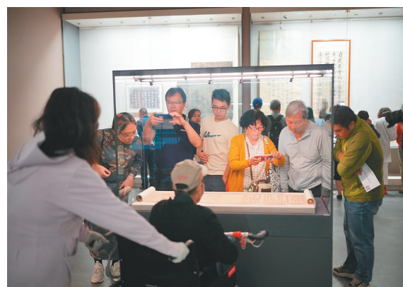
2024年,“千古风流 不老东坡——苏轼主题文物展”在海南省博物馆展出。(资料图)

今年11月,当全国各地的文博人、文博爱好者从全国各地来到海南,他们将看到的不仅是一个展会,更是一座正在快速崛起、充满活力与想象力的文博新高地。海南,正以更加开放的姿态,成为联结世界的桥梁。