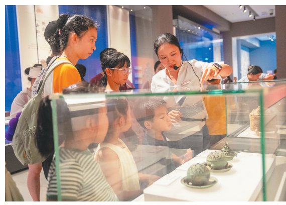
海南省博物馆的讲解员为孩子们介绍汉代的飞鸟带柄熏炉。