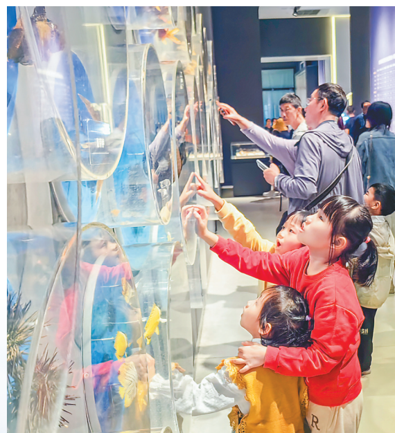
众多家长带着孩子走进海南省博物馆,开启一场别开生面的文化探索之旅。