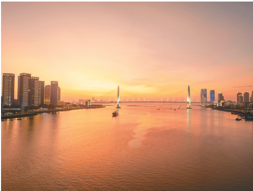
海口湾的黄昏