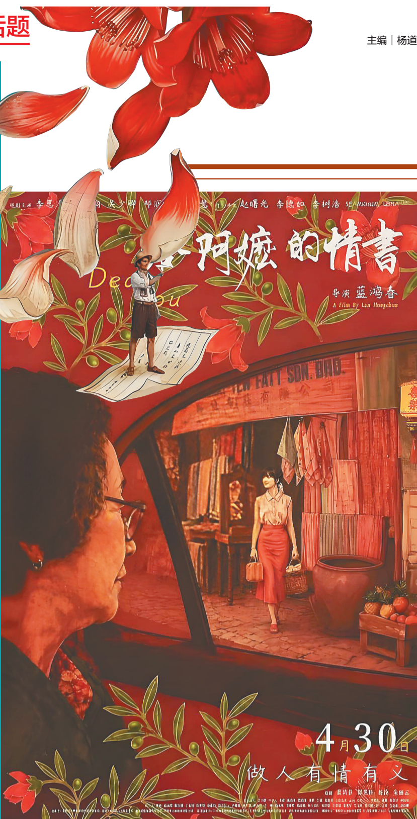
《给阿嬷的情书》海报。