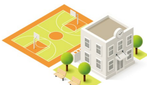
文字/张琬茜 制图/许丽