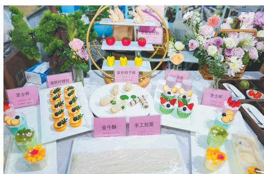
职教周启动仪式上,职业院校学生制作的美食。

“所有技能展示都紧扣‘技能服务美好生活’这一理念,致力于用专业技能服务民生和社会发展。”