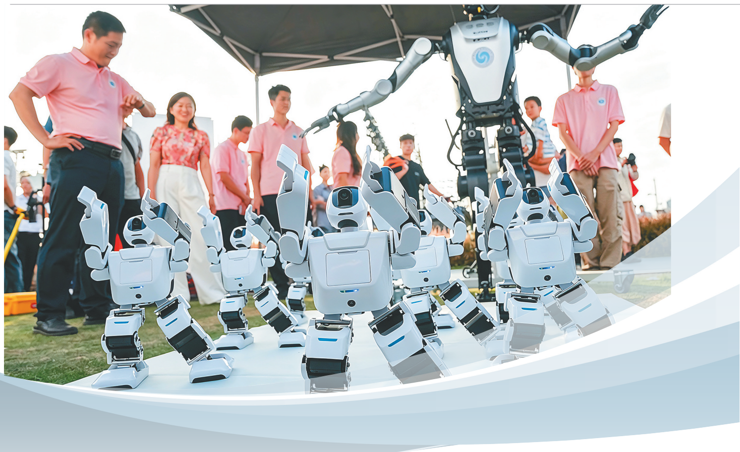
职教周启动仪式上的机器人应用展示。

孟夏时节,万物并秀。日前,海口云洞图书馆外草坪广场上,一场别开生面的“技能秀”吸引人们驻足观看。穿针引线巧织黎锦,推拿按摩手法娴熟,茶艺表演韵味悠长……2026年海南省职业教育活动周(以下简称职教周)暨全省职业院校技能大赛启动仪式在这里举行,数十所职业院校学生秀技能、亮绝活、展风采,热闹非凡。