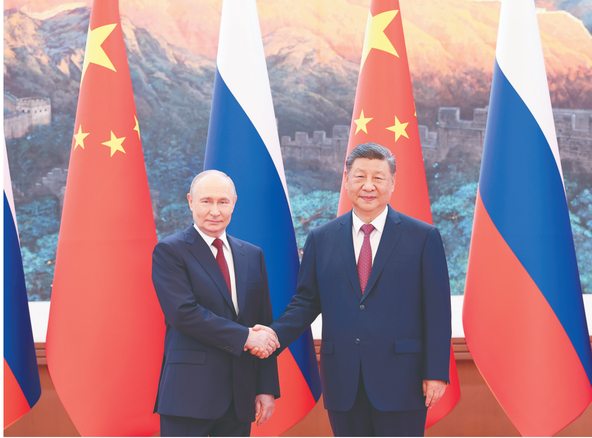
5月20日上午,国家主席习近平在北京人民大会堂同来华进行国事访问的俄罗斯总统普京举行会谈。