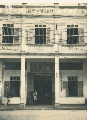
解放初期拍摄的中国银行位于得胜沙97号的琼州分号原址风貌。

站在海南自贸港全岛封关运作的新起点，这封家国情书，还将继续写下去。（撰文/虞林 王莹 林思伟）