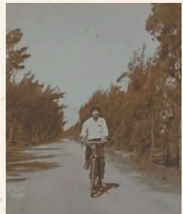
上世纪七十年代中行侨批员派送途中。

在海南中行的历史陈列室里，珍藏着一张上世纪七十年代的老照片：一位侨批员骑着单车，车后绑着鼓鼓囊囊的帆布包，行进在泥泞的乡道上。