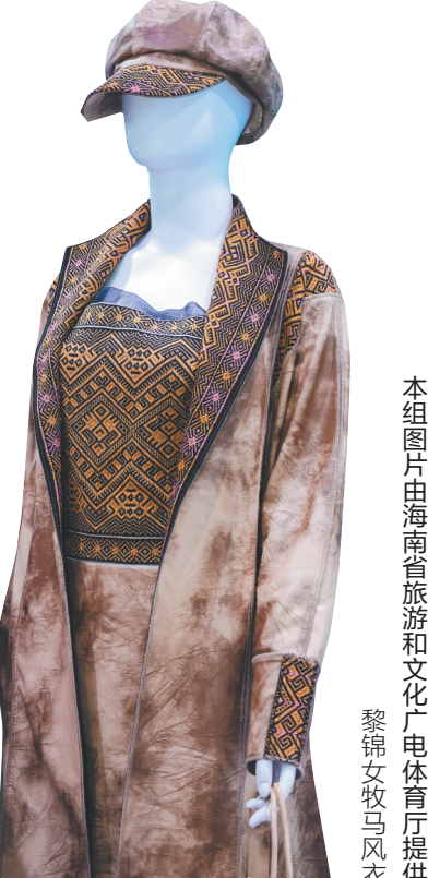
黎锦女牧马风衣。

在首届中国新文创市集上，曾经被贴上“土特产”标签的海南伴手礼，如今正以设计感、科技感、文化感并存的姿态，走向更广阔的舞台。海南省旅游和文化广电体育厅相关负责人说，这背后，是对本土文化的深度挖掘与创造性转化，也是无数文创人敢想敢试、精益求精的生动注脚。可以预见，随着更多新元素、新业态、新模式的注入，海南文创将让更多人读懂海南，爱上海南。