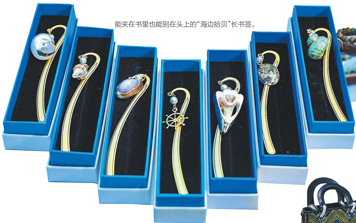
能夹在书里也能别在头上的“海边拾贝”长书签。

在市集里逛了一圈，海南日报全媒体记者发现，与其他地区的展区相比，海南展区的热闹程度确实不落伍。但真正让人意外的，是产品本身。