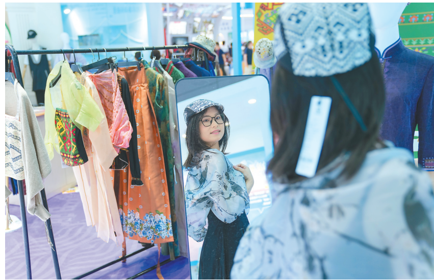
5月23日,在深圳文博会海南馆,观众试戴融入黎锦元素的帽子。

在海南展馆,许多黎锦文创产品紧跟新风融入现代潮流,浸润日常生活。比如,海口甘工旅游文化有限公司对黎锦纹样进行分解和重构,在保留典型特征和基本构成的基础上加入流行时尚元素,打造出女蛙系列、大力神系列、甘工鸟系列等文创产品;东方黎锦之乡文化发展有限公司将传统手工艺与现代设计理念相结合,开发出黎锦包包、围