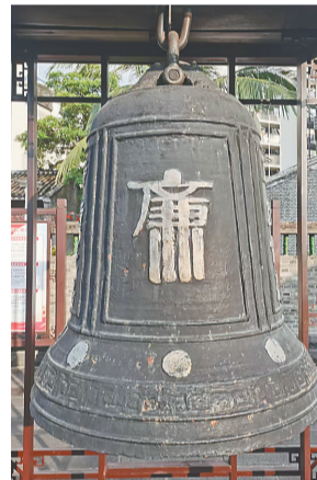
海瑞故居里的长鸣钟。

[作者系海南师范大学文学院教授，本文系国家社科基金特别委托重大项目“丘濬思想文化及传播研究”（24@ZH037）的阶段性成果]