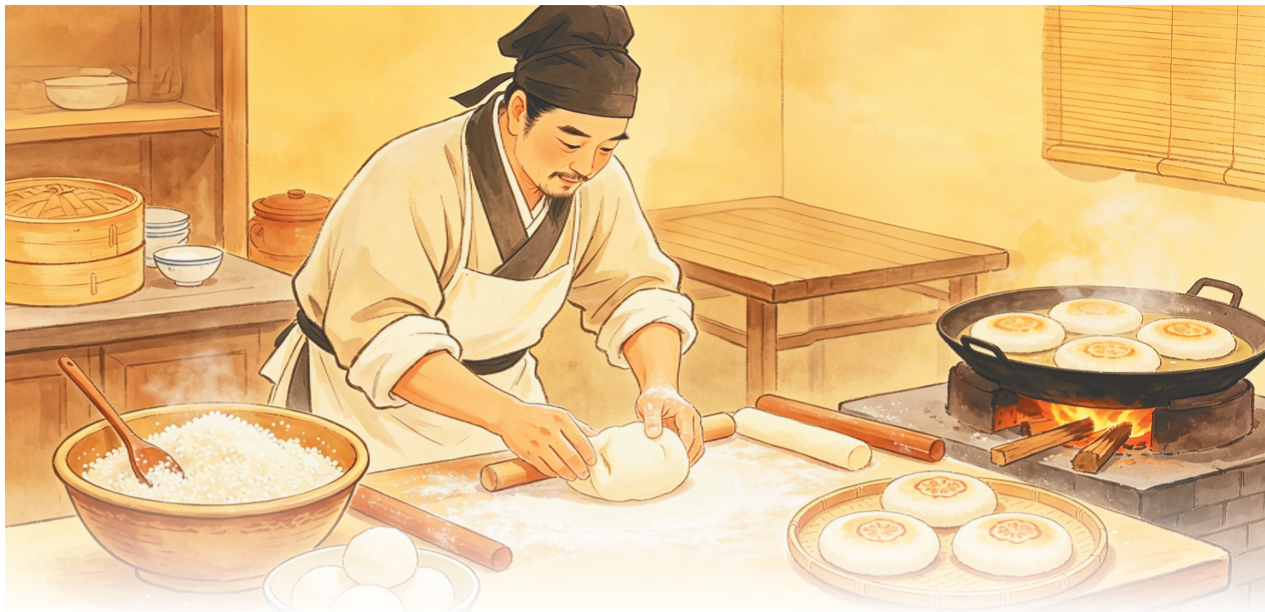
丘濬制作的面饼被称为「阁老饼」。徐珊珊之绘图

在历史的长河中，海瑞闪耀着独特的光芒，传奇人生轰轰烈烈，被誉为“南海青天”。与海瑞并称“海南双璧”的丘濬，则有着另一番清廉佳话。