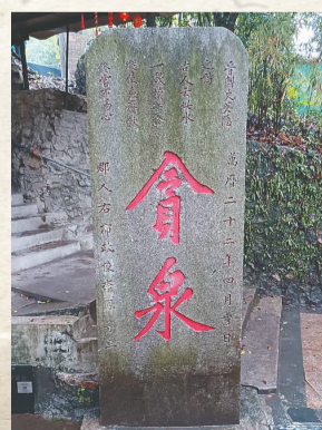
位于广州市白云区的石门贪泉遗址。资料图